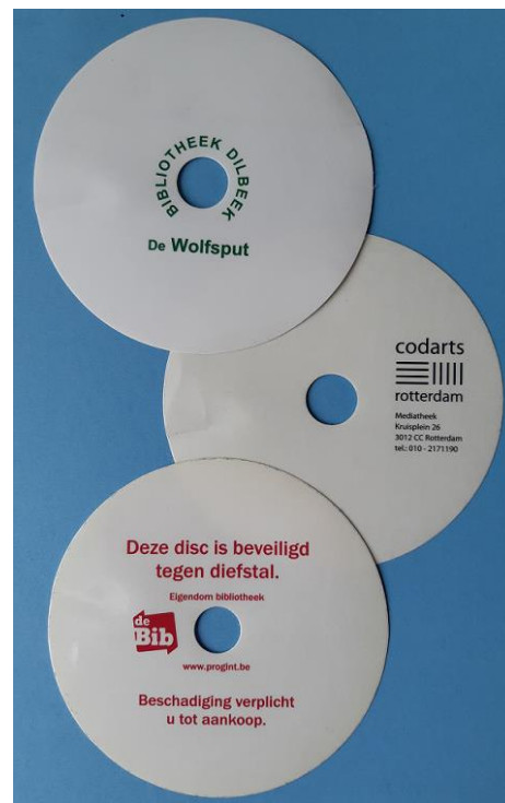
117mm Eigendomslabel bedrukt 1 kleur

Personalisatie / het laten bedrukken op de sticker van de gegevens van de bibliotheek beschermt tegen diefstal en omruiling van de disk. U krijgt altijd uw eigen ontleende disks terug van de lener.