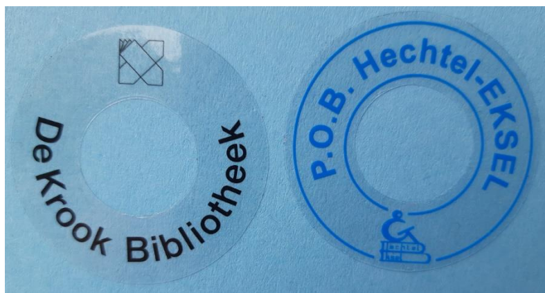
40mm Eigendomslabels bedrukt in 1 kleur

Deze labels kunnen in 1 kleur bedrukt worden.